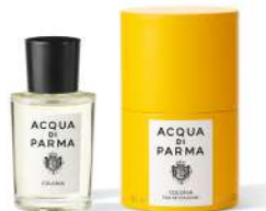
COLONIA 50 ml / 1.69 f.oz. Ref. ADPO82805

Le Colonie in a smart travel size 50ml. The perfect combination of perfumes for men, packed in the iconic Hat Box.