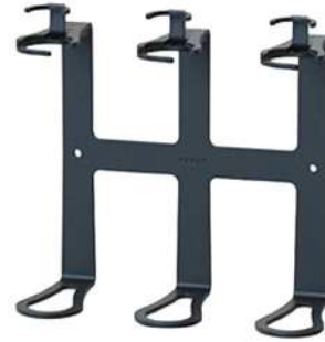
BRACKET CERAMICA (3PCS)