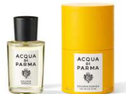
COLONIA ESSENZA 50 ml / 1.69 f.oz. Ref. ADPO82816