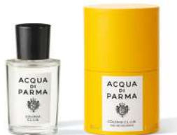
COLONIA C.L.U.B. 50 ml / 1.69 f.oz. Ref. ADPO82820