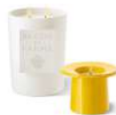
1,6Kg + 330gr - Ref. ADPO82256