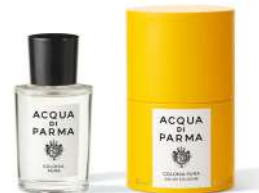
COLONIA PURA 50 ml / 1.69 f.oz. Ref. ADPO82812