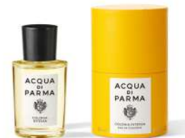
COLONIA INTENSA 50 ml / 1.69 f.oz. Ref. ADPO82809